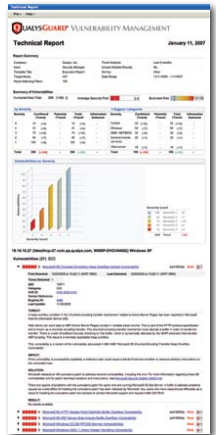
Relatório de Gerenciamento de Segurança