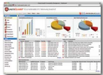
Dashboard Customizable por Usuário

Visite www.digital-it.com.br para conhecer mais detalhes sobre os nossos produtos.