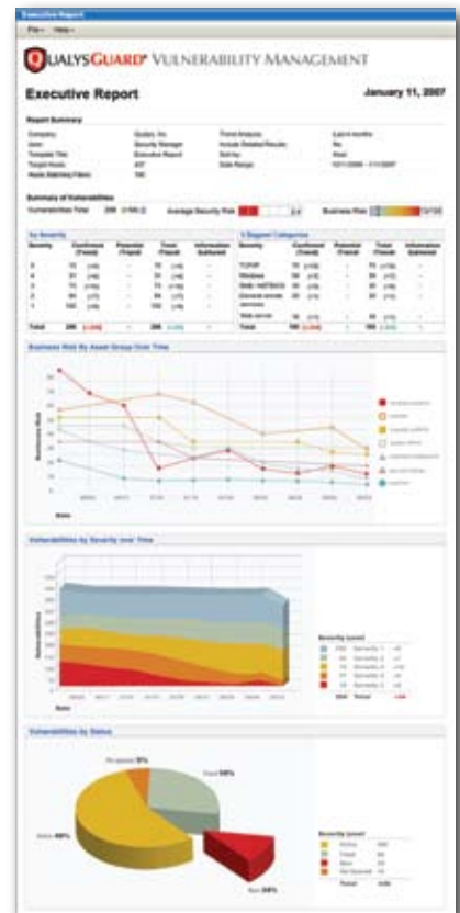
Relatório de Tendências de Risco